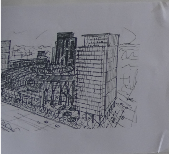
te Schița Mall-ului